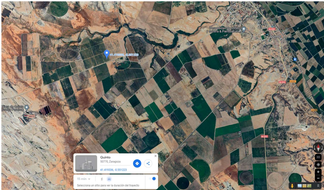
Figura 1. Ejemplo obtención coordenadas WGS84 , Google Maps.

Es muy importante que, si se trata de una solicitud de valoración vinculante, la ubicación indicada sea exactamente la del módulo de inyección. En caso contrario la valoración podría no ser ajustada a la realidad de su proyecto.